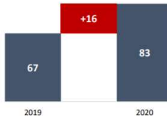
Pobreza extrema (millones de personas)

Fuente: Comisión Económica para América Latina y el Caribe (CEPAL).